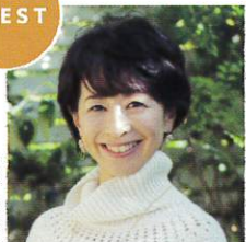
阿川佐和子 （文筆家）

1953年東京に生まれる。慶応義塾大学文学部西洋史学科卒業。TBS「朝のホットライン」「情報デスクToday」「筑紫哲也NEWS23」などでリポーターやキャスターを務める。檀ふみとの共著『ああ言えばこう食う』で、第15回講談社エッセイ賞受賞。「ウメ子」で、第15回坪田譲治文学賞、「婚約のあとで」で第15回島清恋愛文学賞を受賞するなど、作家として活躍している。現在は、テレビ朝日「たけしのTVタックル」「日曜マイチョイス」にレギュラー出演中。2012年に出版された『聞く力』は170万部を超えるベストセラーとなっている。